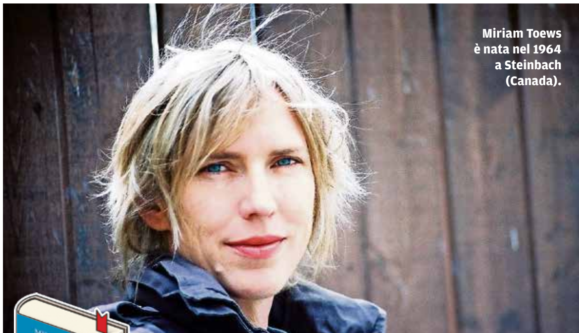
Miriam Toews è nata nel 1964 a Steinbach (Canada).