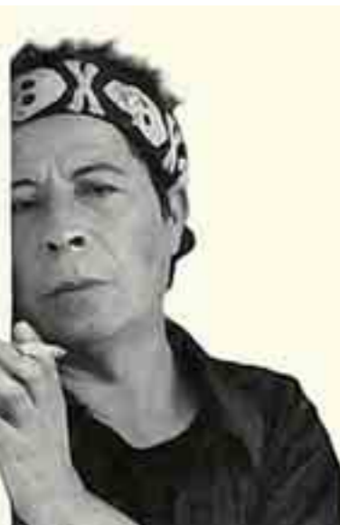
> Pedro Lemebel durante una sua performance. A destra, Santiago, 11 settembre 2006, manifestazione in ricordo delle vittime della dittatura

Le cose sono cambiate molto e sono in continua evoluzione. Il rapporto con il Partito Comunista è andato migliorando da quando nel 1997 è diventata segretaria Gladys Marín, morta tre anni fa. Da allora partecipiamo alla marcia comune, ci appoggiamo a vicenda. Però rispetto alla situazione generale del Cile io rappresento una eccezione: sono uno scrittore, un "intellettuale" e sono rispettato, ma non so se è la stessa cosa con un travestito di strada, ad esempio. Dovrebbe esserlo certo, per me un travestito quando si dipinge il volto è come se stesse scrivendo.