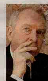
BIENNALE L'architetto David Chipperfield

VENEZIA - Si intitola «Common ground», terreno comune, la tredicesima Biennale Architettura. Sarà inaugurata il 29 agosto, diretta dall'inglese David Chipperfield. Un “common ground”, ha sottolineato il curatore, che sia «un atto deliberato di resistenza» contro la spettacolarizzazione dell'architettura che «privilegia la singola costruzione, i singoli progetti scaturiti dalle menti di talenti individuali». Spazi ed edifici vanno invece pensati a partire da una comune condivisione, insiste Chipperfield, che molto spesso è stato associato al mondo delle archistar. Per Chipperfield, l'architettura è «legata, intellettualmente e praticamente, al sociale, alla condivisione di problemi, influenze e intenti». In un momento in cui l'architettura «viene tirata per la giacca» da tutte le parti ed è smarrita - ha sottolineato Paolo Baratta, presidente della Biennale - quella di Venezia sarà una «mostra di aggiornamento per tutti».