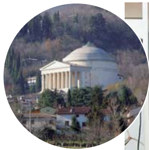
Fulvio Ervas, autore di «Pinguini arrosto» (Balanza). Sopra, il tempo di Possagno