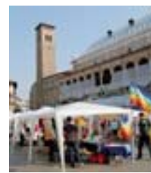
Volontariato Piazza della Frutta ospiterà gli stand delle associazioni

Organizzata, come succede ormai dal 2004, dal Csv, dall'Usl 16 e da Legambiente. In piazza della Frutta, dalle 10.45, concerto della banda di Selvazano Dentro, maratona fotografica, spettacolo di capoeira ed esibizioni musicali del gruppo Voice in Pro-